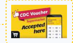
Gambar-gambar hanya sebagai contoh sahaja.